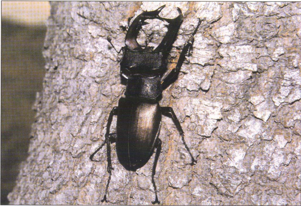
Fig. 7. Lucanus cervus (Linnaeus, 1758).