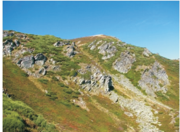
Fig. 1-6. D. (I.) vanhoegaerdeni . 1. Mapa distribución. 2. Hábitus. 3-5. En su hábitat natural. 6. Hábitat en la Sierra del Coto.