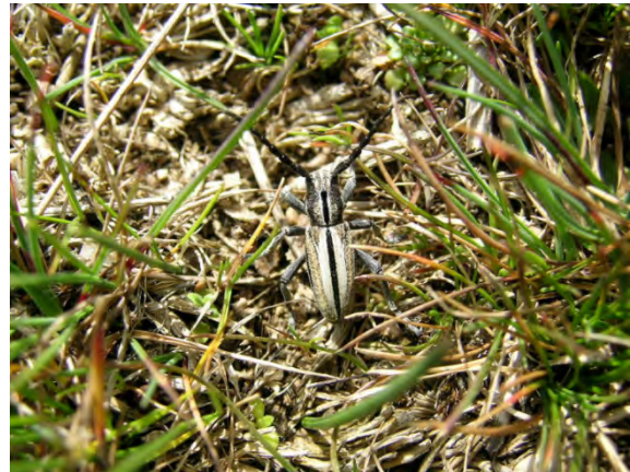
Fig. 2. I. ghilianii en su medio natural (Sierra de la Paramera) Fig. 2. I. ghilianii in its natural environment (Sierra de la Paramera).