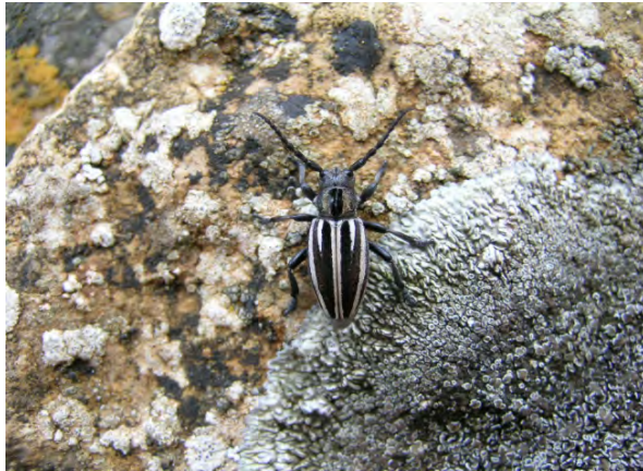
Fig. 1. I. segovianum en su medio natural (Sierra de Gredos) Fig. 1. I. segovianum in its natural environment (Sierra de Gredos).

El presente estudio se ha abordado desde una doble perspectiva metodológica, primero geomorfológica clásica (cartografía geomorfo-