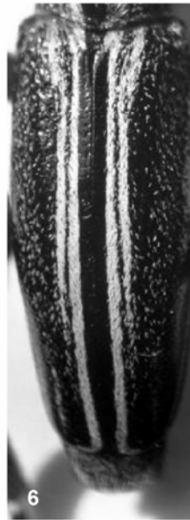
Foto 1. Lectotipo y ejemplar con la misma etiqueta de localidad de D. (I.) nudipenne Col. Museo Nacional de Ciencias Naturales Madrid. Foto 2. D. (I.) hispanicum . Ejemplar semejante a tipo. Col. M. Tomé. Foto 3. D. (I.) ghilianii . Ejemplar semejante a tipo. Col. M. Tomé. Fotos 4, 5, 6. Morfología de los élitros en D. (I.) hispanicum , D. (I.) ghilianii y D. (I.) nudipenne . Foto 7. Hábitat de D. (I.) hispanicum Puerto de Somosierra (Madrid). Foto 8. Hábitat de D. (I.) ghilianii Pto. de la Lancha (Avila). Foto 9. Hábitat de D. (I.) nudipenne Cerezo de Arriba (Segovia).